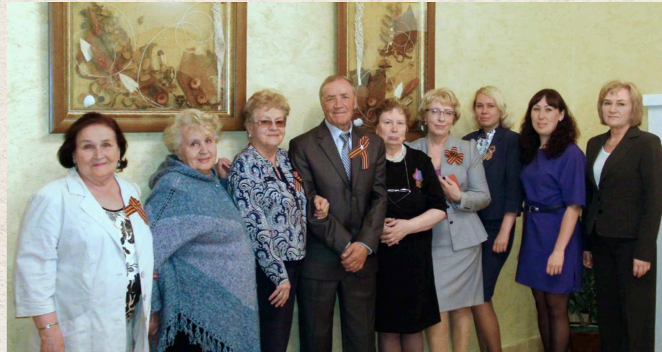
Встреча ветеранов профсоюзного движения с Аппаратом республиканского комитета профсоюза. 2015 год