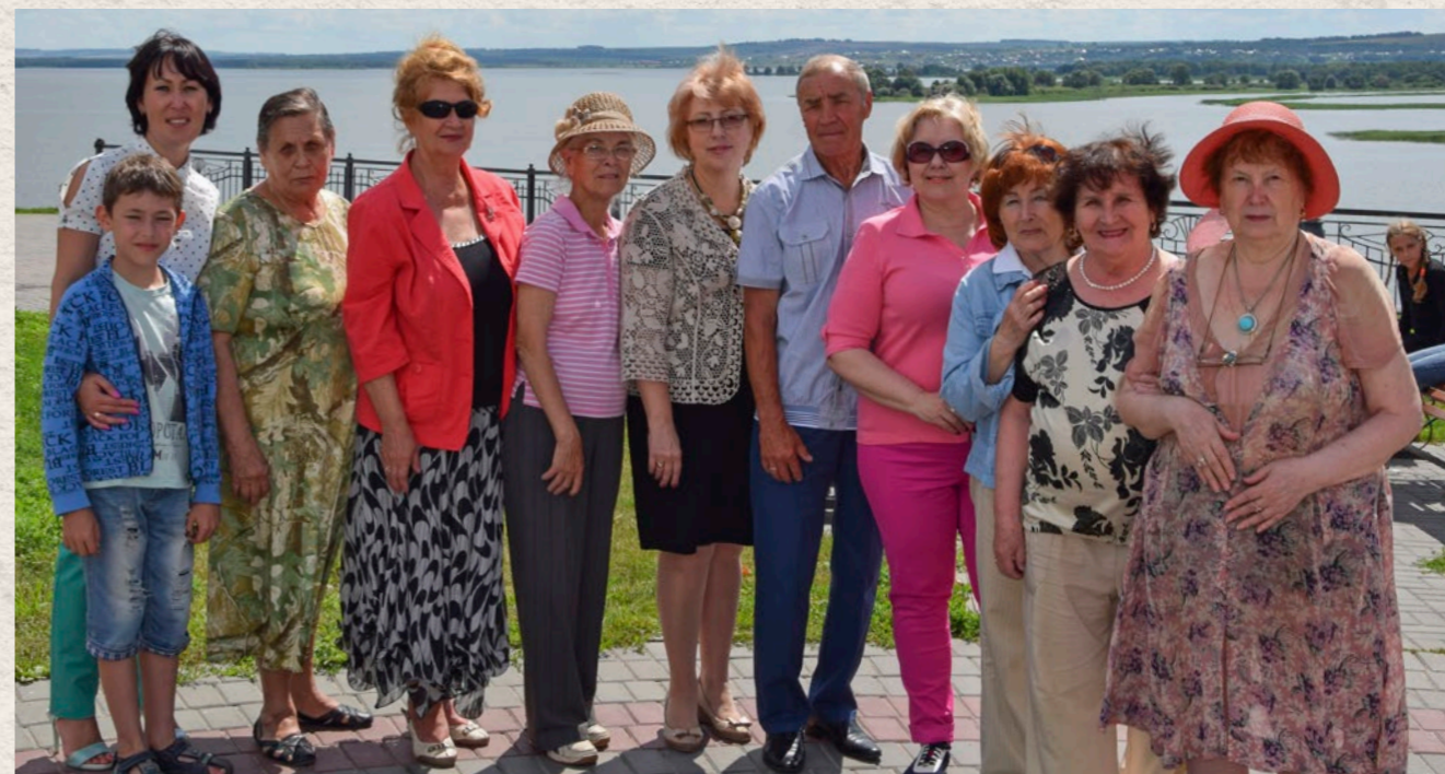
Выездное мероприятие с участием ветеранов профсоюзного движения, посвященное 85-летию образования Татарстанской республиканской организации профсоюза. 2016 год